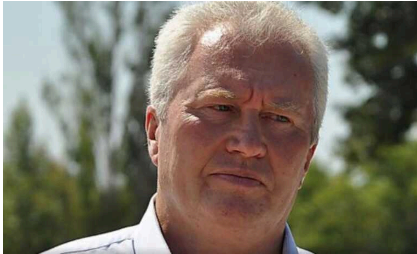
Екснардепу Корнацькому повідомили про підозру: незаконно отримав компенсацію за житло

Колишньому народному депутату Аркадію Корнацькому повідомлено про підозру у незаконному отриманні понад 900 000 гривень компенсації за оренду готельного номера в Києві, попри те, що він є власником квартири у столиці.