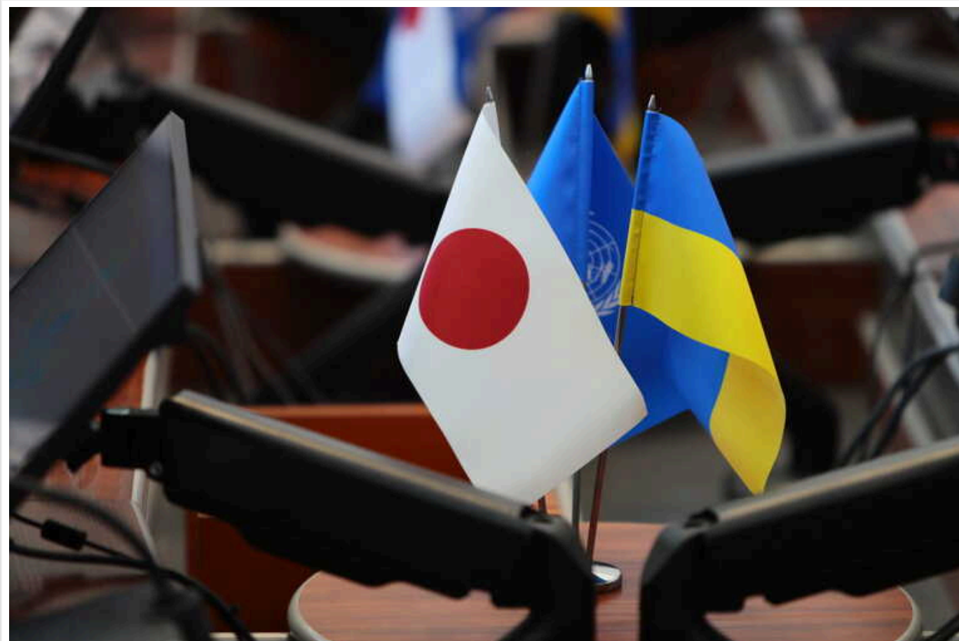
Україна вже отримала половину грошей, які Японія пообіцяла за угодою про гарантії безпеки

Про це повідомив нардеп Ярослав Желзняк.