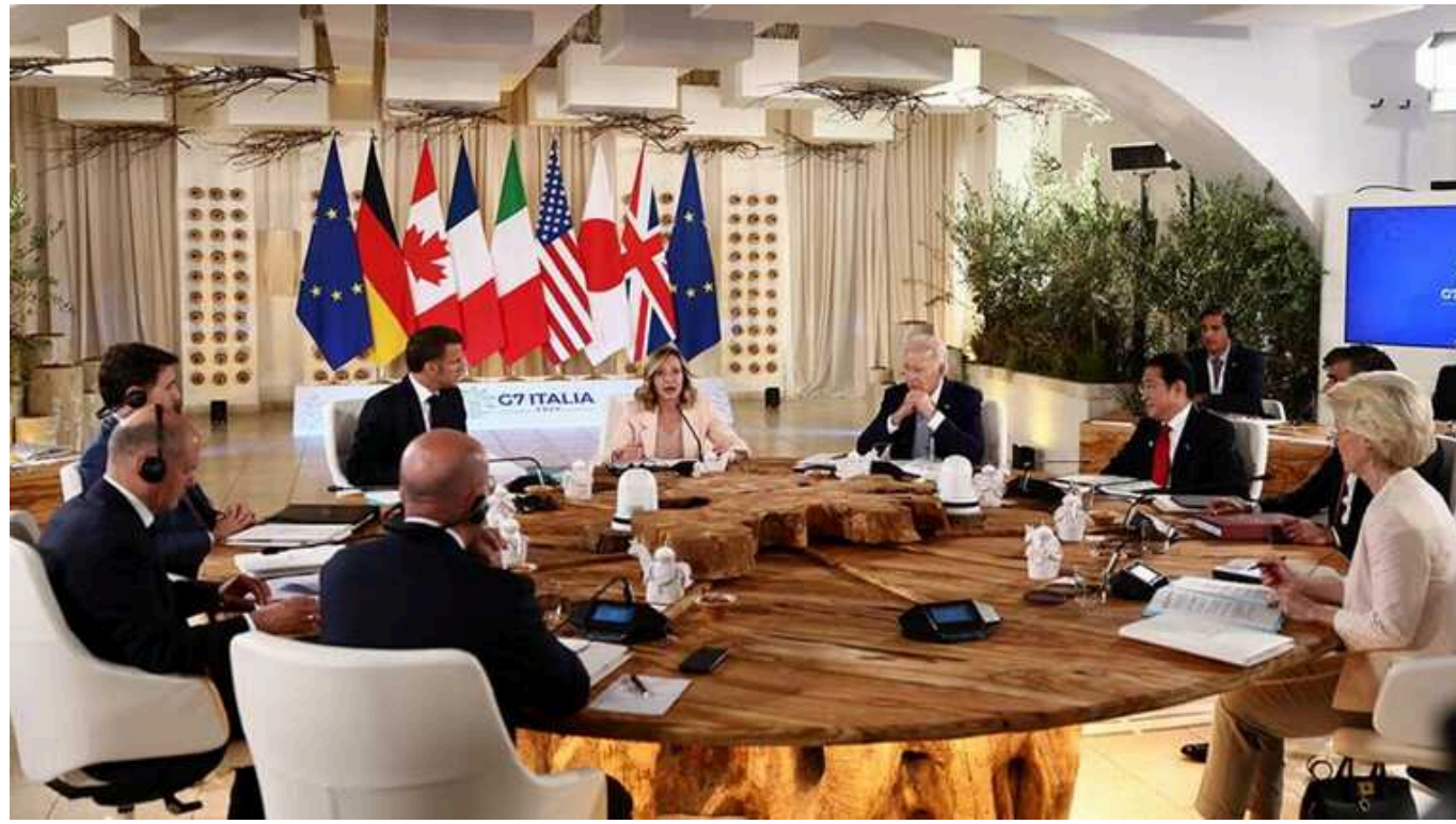
Угода G7 про кредит Україні за рахунок доходів від активів РФ має бути схвалена Євросоюзом

Про це заявив високопосадовець адміністрації Байдена, пише видання The Financial Times.