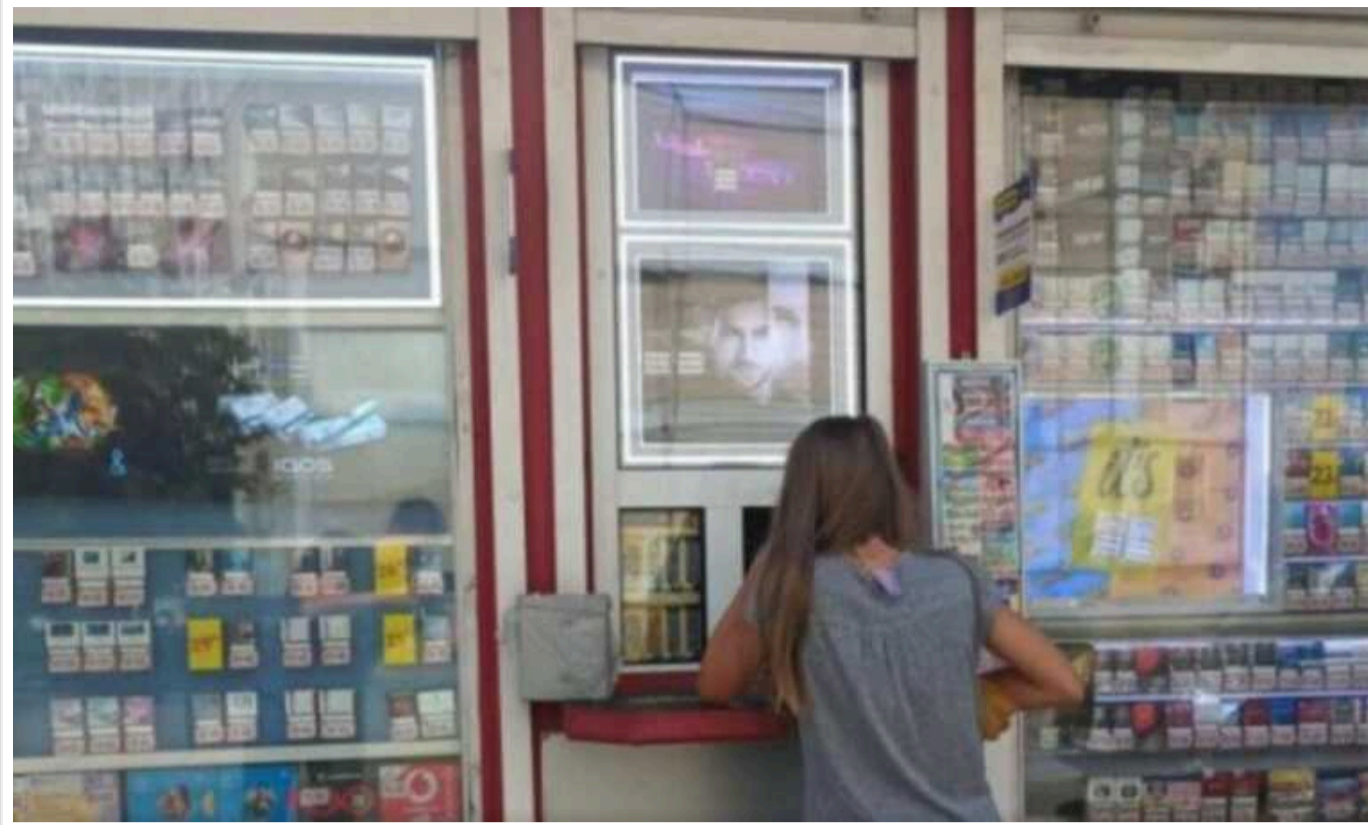
У Києві заборонили продаж тютюнових та підакцизних товарів у всіх кіосках та МАФах

Київська міська рада ухвалила оновлені правила розміщення кіосків і МАФів.