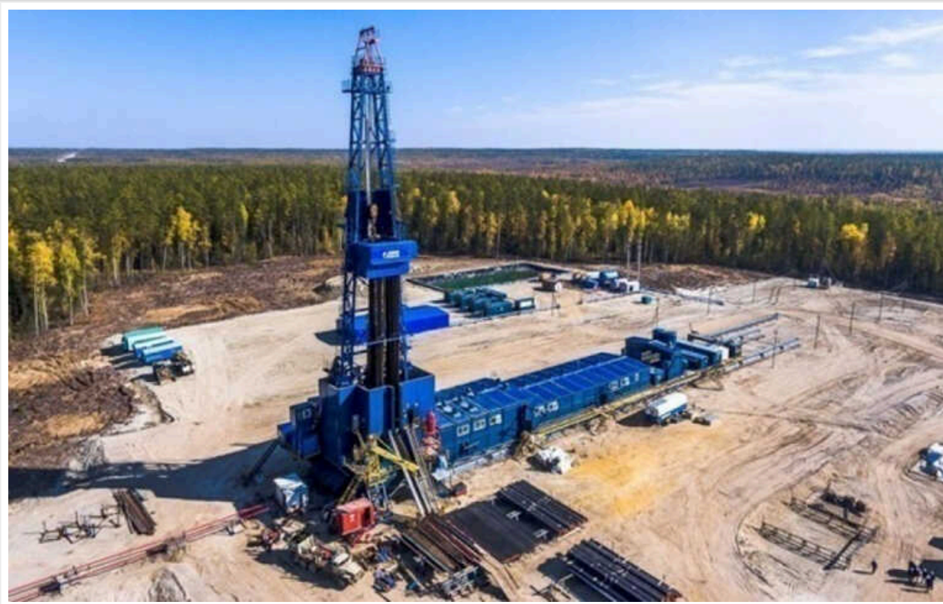
В Україні запустили ще одну газову свердловину

В Україні запустили нову газову свердловину. Вона дає 280 тисяч кубометрів газу на добу.