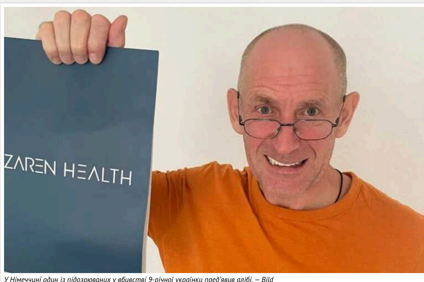
У Німеччині один із підозрюваних у вбивстві 9-річної українки пред'явив алібі, – Bild