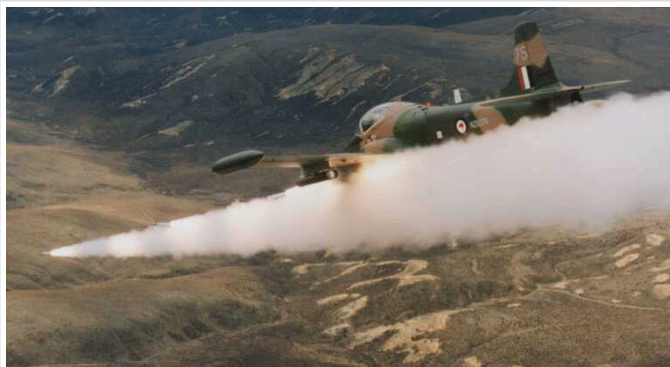
Україна отримає від Канади тисячі авіаційних ракет CRV7