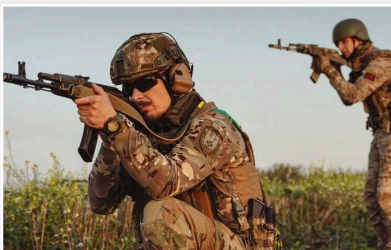
Прикордонники показали кадри бою з ворогом у Вовчанську

Російські окупанти намагалися захопити кілька висот неподалік Вовчанська. Але українські прикордонники зірвали їхні плани та вступили в бій.