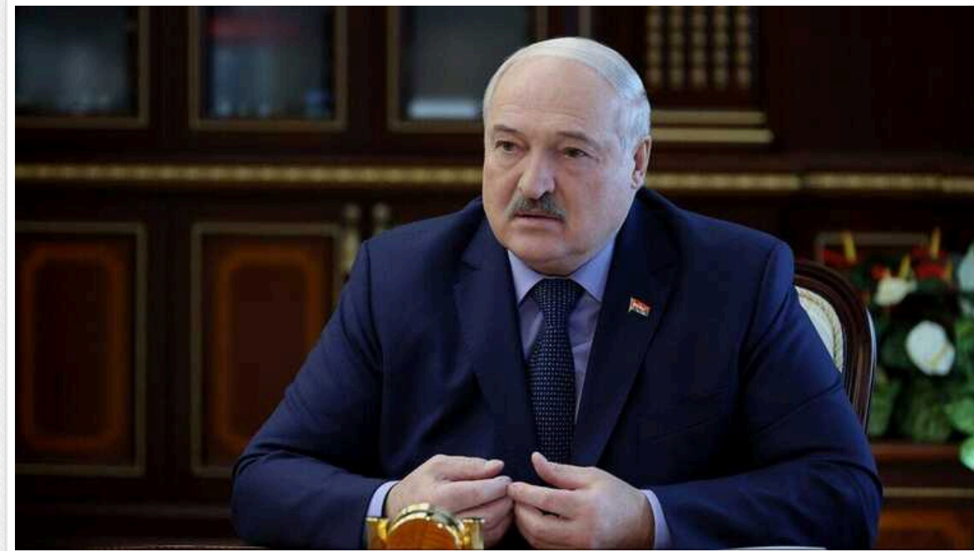
Після слів Лукашенка про Карабах Вірменія викликає посла з Мінська

Посла Вірменії в Білорусі Разміка Хумаряна 13 червня викликали до Єревана для консультацій.