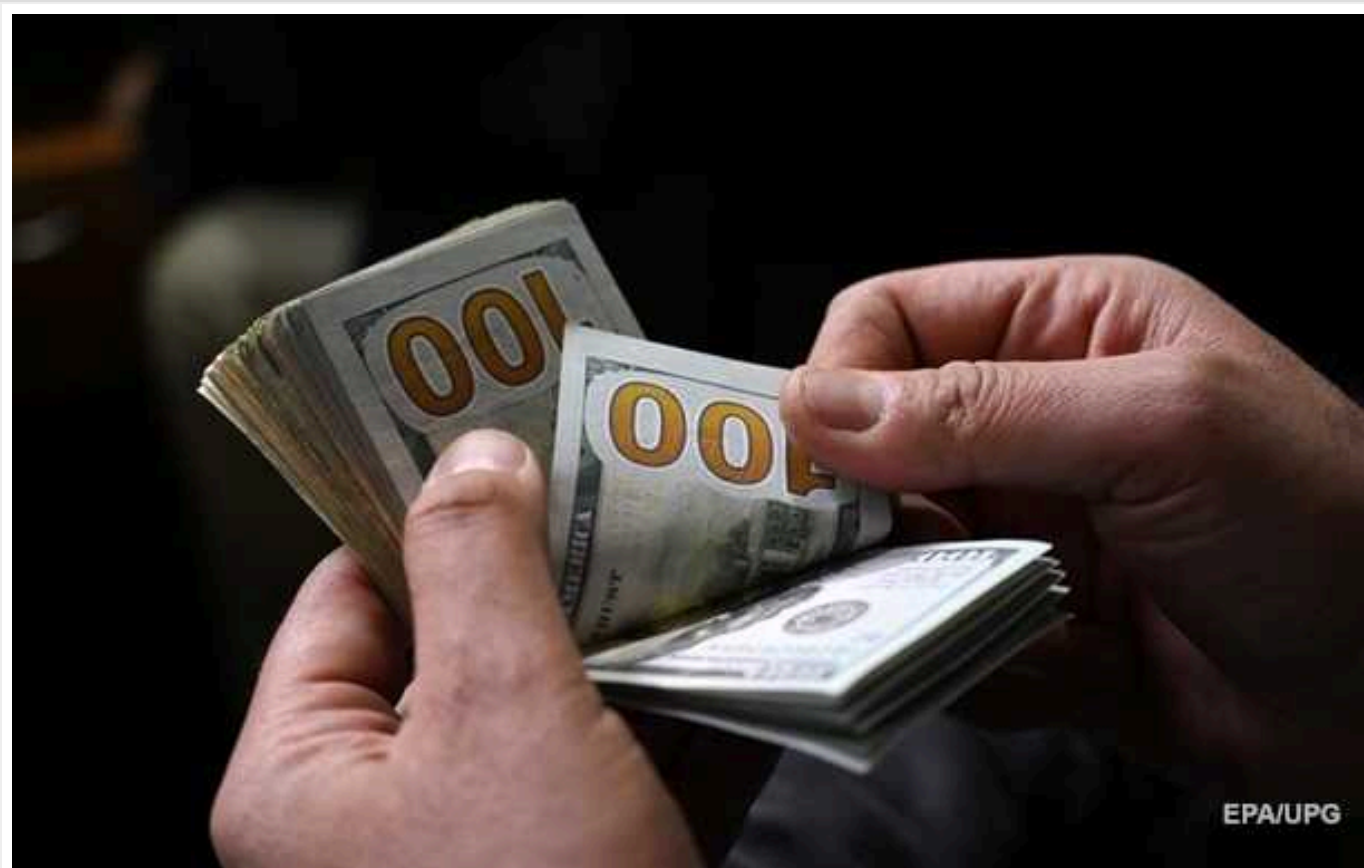
Нацбанк різко підвищив курс долара

Національний банк України підвищив курс долара до гривні до історичного максимуму.