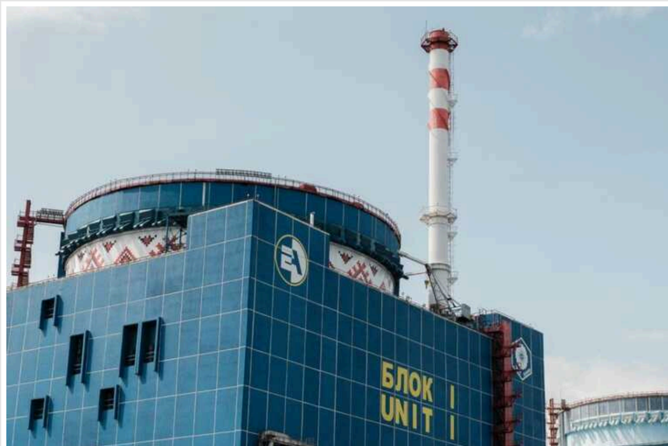
"Найближчими днями" ситуація зі світлом може погіршитися, оскільки буде виведено в ремонт енергоблок АЕС, - "Енергоатом"