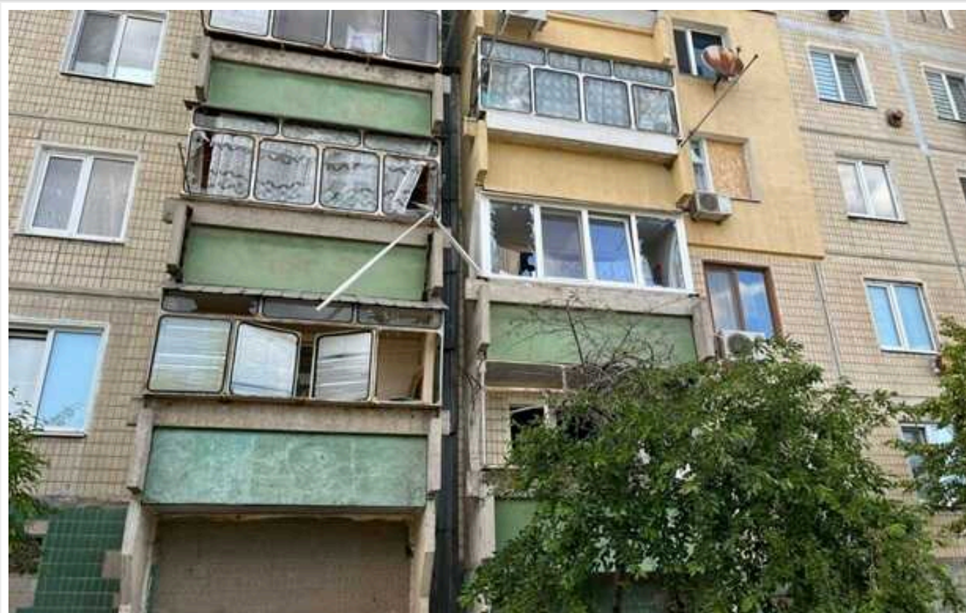
Окупанти атакували Новомосковськ: постраждали двоє дітей

У Новомосковську на Дніпропетровщині внаслідок російської атаки сталася пожежа, постраждали двоє дітей - 3 і 12 років.