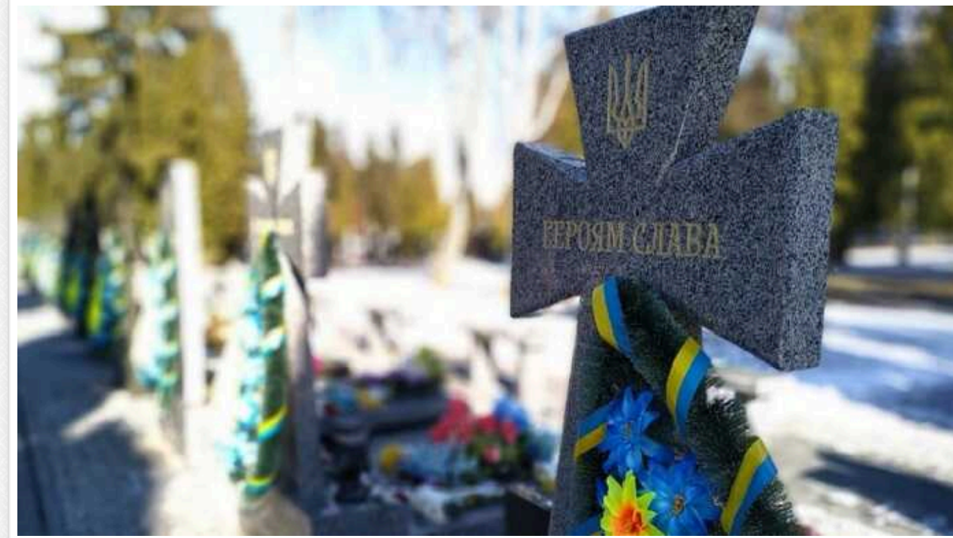
Кабмін затвердив порядок перепоховання на Національному військовому меморіальному цвинтарі під Києвом