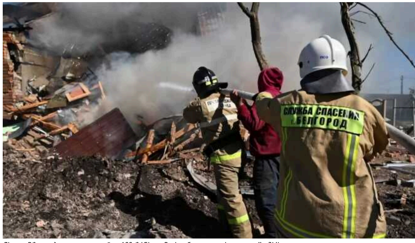
Літаки РФ випадково скинули майже 100 ФАБів на Росію або окуповані території, - ЗМІ

За даними російських ЗМІ, за останні 4 місяці російські ПКС щонайменше 93 рази випадково бомбили Белгородську область і окуповані території.