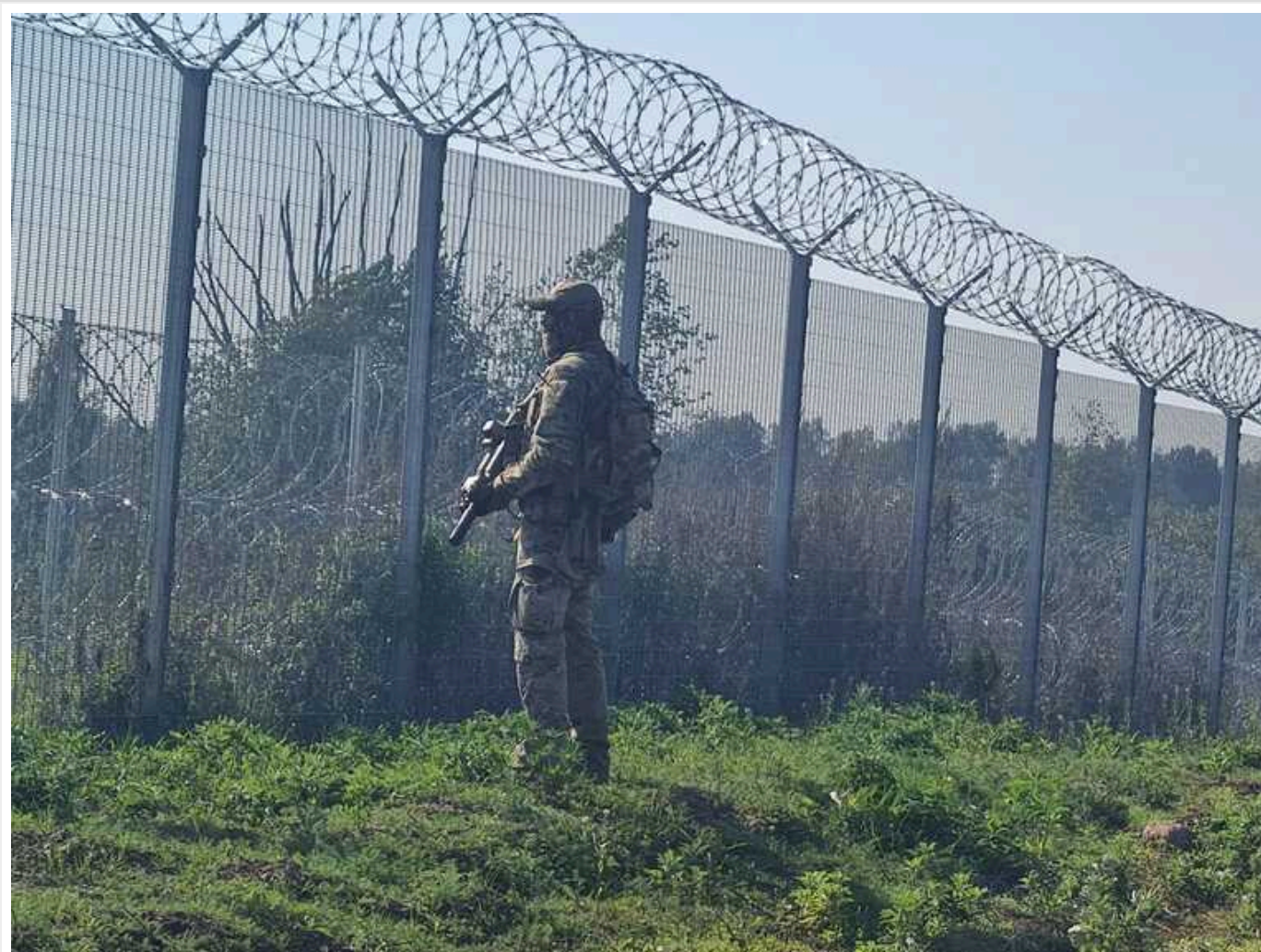
Латвія вже збудувала 130 кілометрів паркану на кордоні з РФ

На латвійсько-російському кордоні звели близько 130 кілометрів паркану, що становить 46% від загальної протяжності кордону.