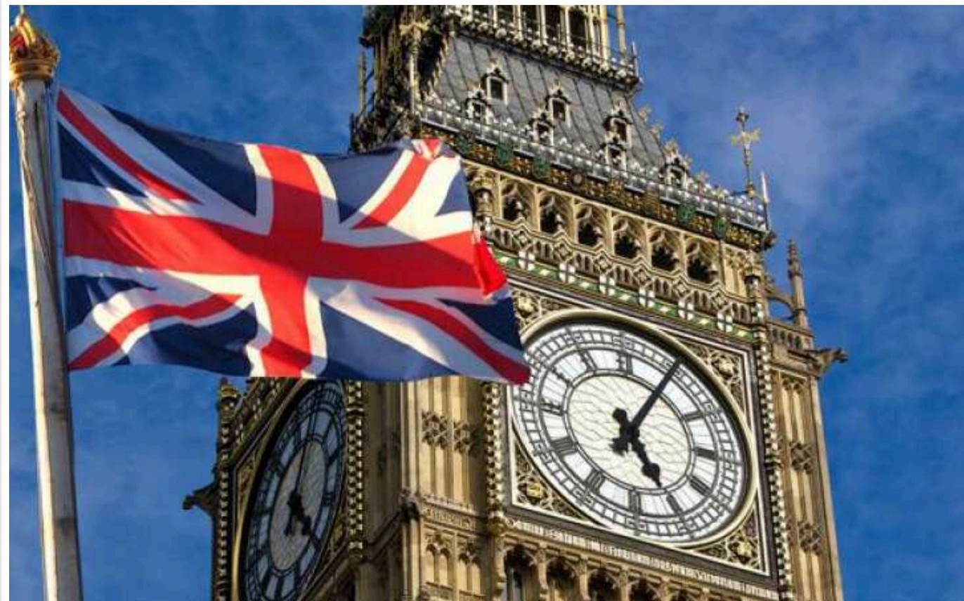
Велика Британія оголосила нові санкції проти РФ, у тому числі - проти її "тіньового флоту" танкерів

Сполучене Королівство оголосило нові санкційні обмеження проти Росії, спрямовані на ускладнення її ведення війни проти України.