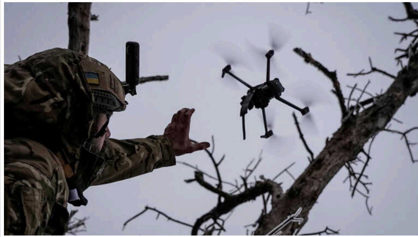
Велика Британія та Латвія оголосили тендер на закупівлю дронів для України

Члени Коаліції дронів виберуть кілька виробників для постачання українським військовим БПЛА у великих обсягах. Це можуть бути компанії й з України.