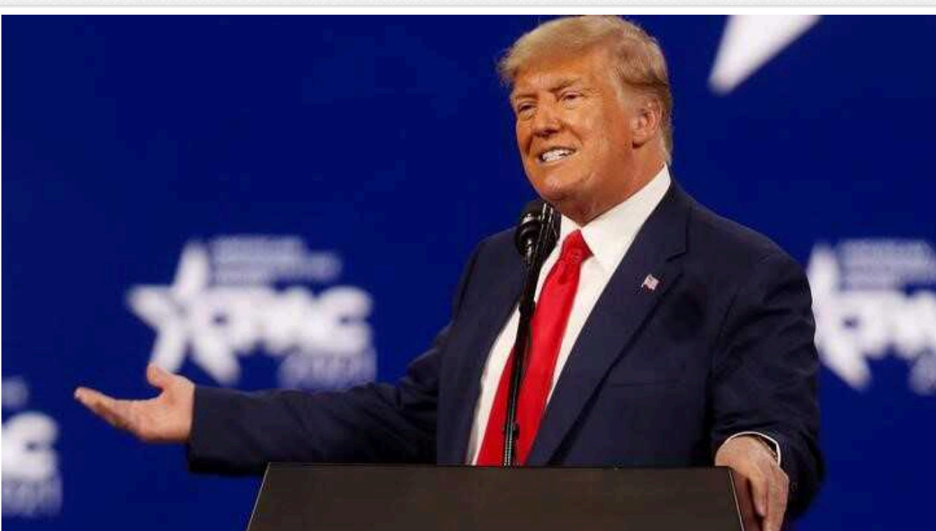
Чому американські мільярдери вкладають у Трампа: шкурний інтерес та зв'язки з Росією

Великий бізнес сподівається отримати негайний прибуток, але збагатяться вони за рахунок загального добробуту країни та здоров'я американської демократії.