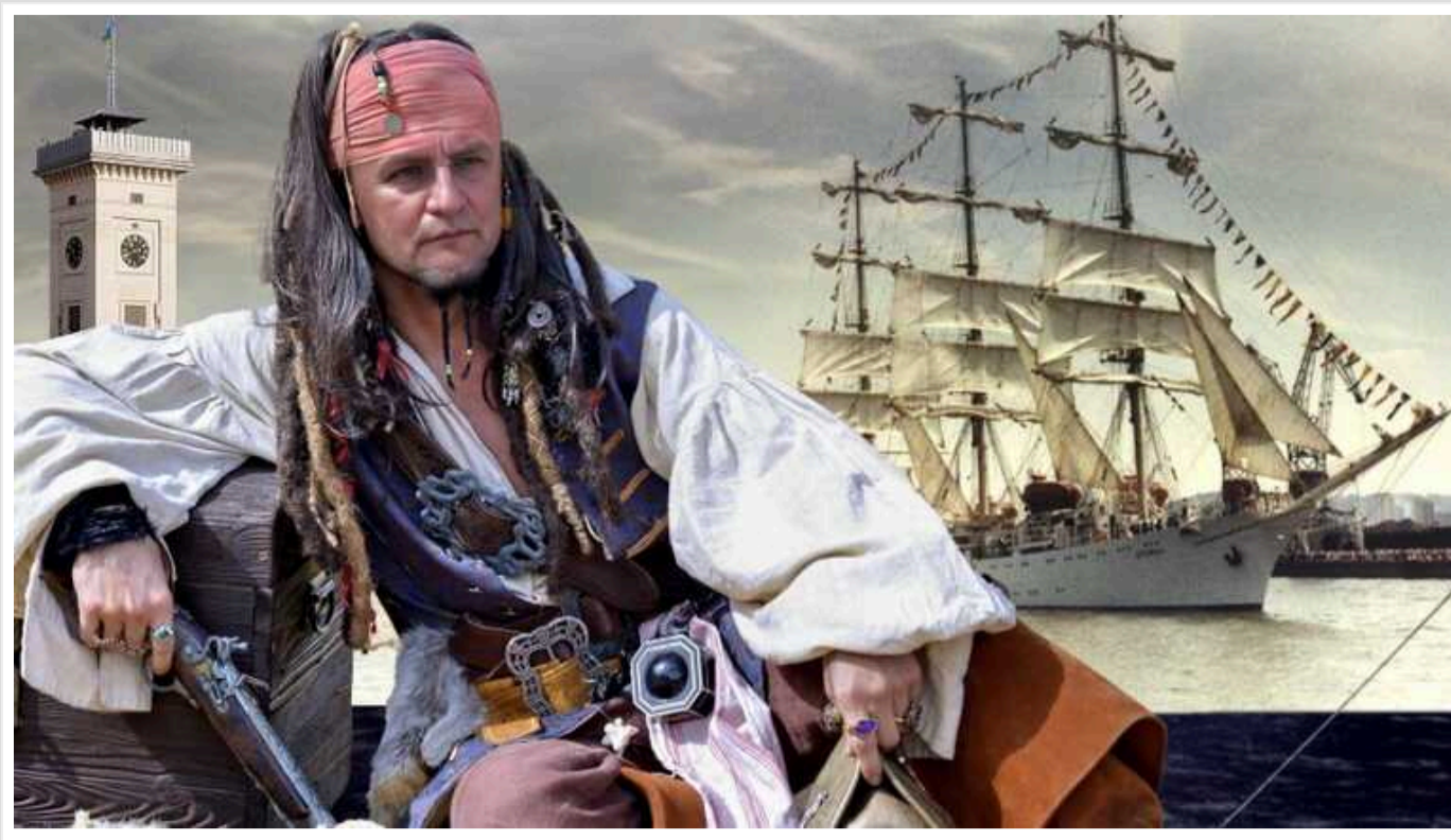
Пірати Львівського моря: ЗМІ розповіли, як Андрій «Горобець» Садовий поцупив 20 мільйонів

Мер Львова Андрій Садовий потрапив у черговий корупційний скандал, але цього разу, зачепивши інтереси українських військових. Журналісти зацікавилися долею 20 млн грн, які, за ініціативи Садового, були направлені на потреби Військово-морських сил у грудні 2023 року. І схоже на те, що вони були викинуті на вітер у буквальному сенсі – при незакритих запитах військових із різних підрозділів, які постійно потребують FPV-дронів та іншого обладнання для відсічі російській агресії.