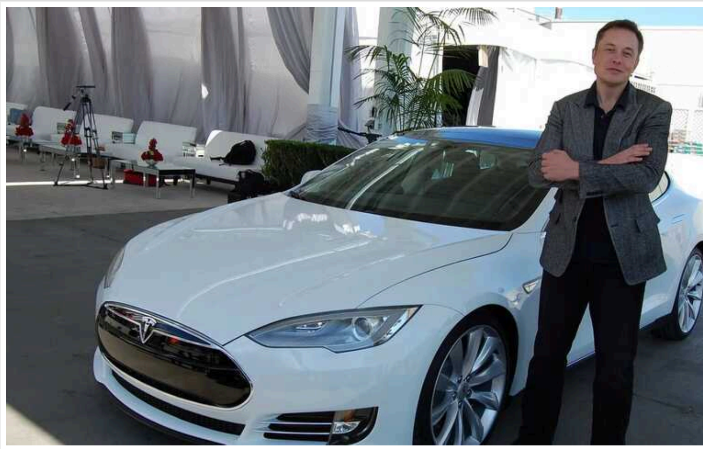
Інвестори Tesla хочуть відсудити у Маска 30 мільярдів доларів

Акціонери виробника електроавтомобілів Tesla подали позови до його генерального директора Ілона Маска. Його звинувачують в інсайдерській торгівлі акціями компанії, що дозволило йому заробити мільярди доларів.