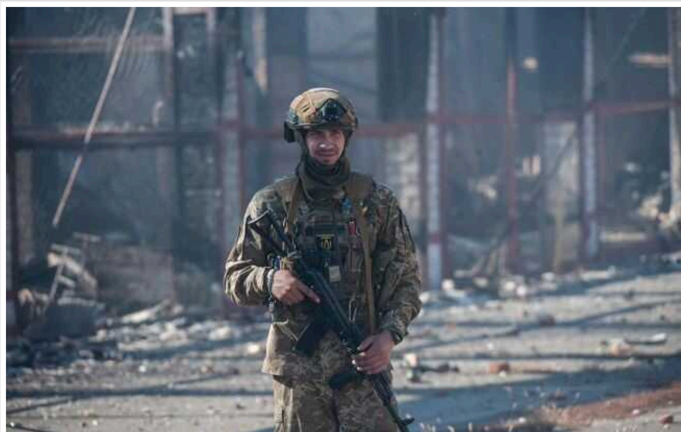
ЗСУ використовують Bradley в "екстремальні способи", - WP

БМП Bradley гнала назустріч ворожій машині з піхотою, коли зазнала "катастрофічного" удару і втратила основну зброю. Проте командир не розглядав варіантів зупинятися.