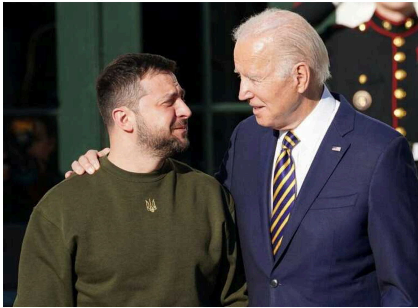
Байден підпише угоду про безпеку з Україною під час саміту G7, – Reuters

Президент США Джо Байден підпише нову угоду про безпеку з Президентом України Володимиром Зеленським, у якій пообіцяє довгострокову підтримку під час зустрічі лідерів "Великої сімки" в Італії.