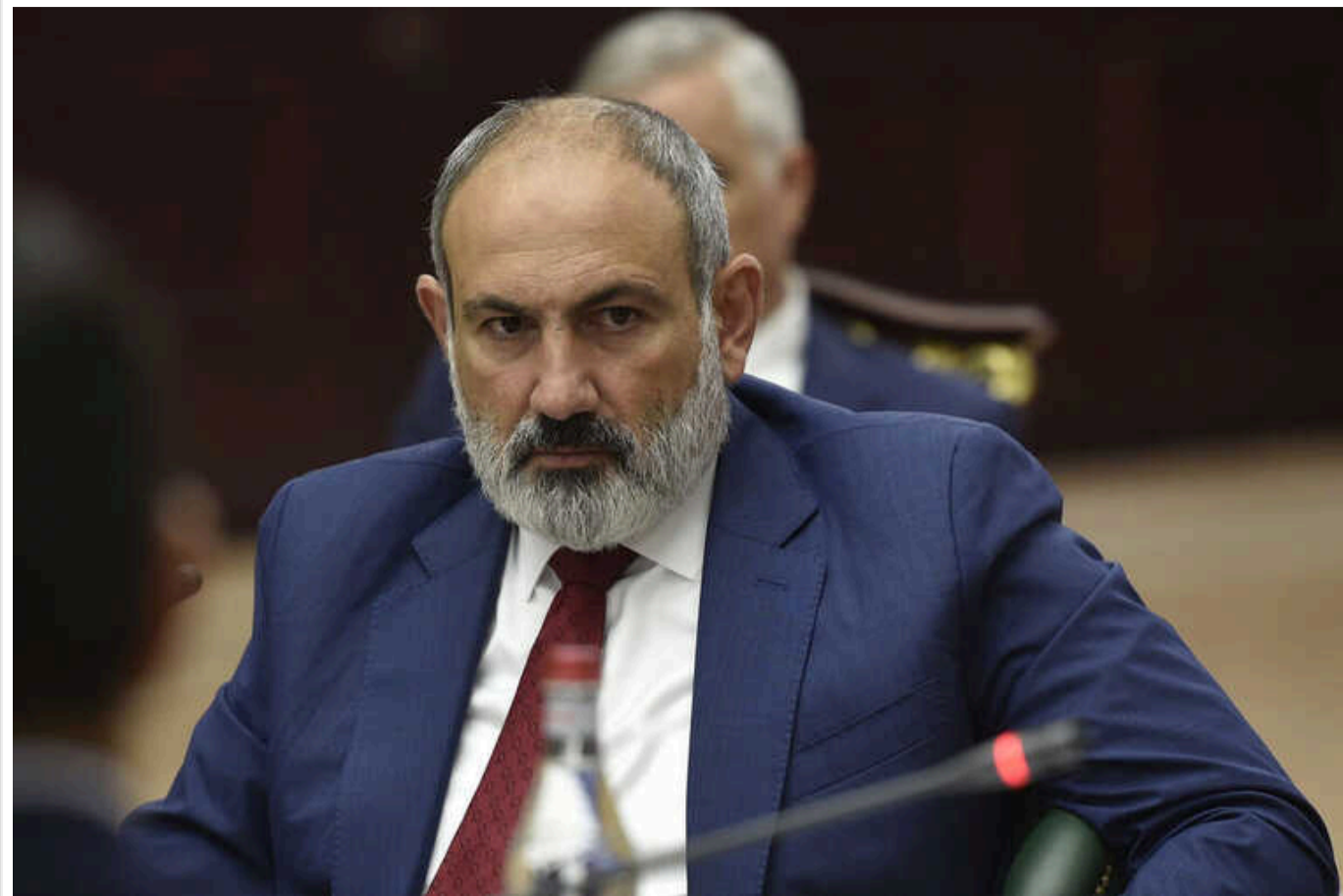
Пашинян заявив, що не поїде в Білорусь, поки там керує Лукашенко

Прем'єр-міністр Вірменії Нікол Пашинян заявив, що ні він, ні жоден інший офіційний представник Вірменії, ніколи не відвідає Білорусь, поки керівником цієї країни є Александр Лукашенко.