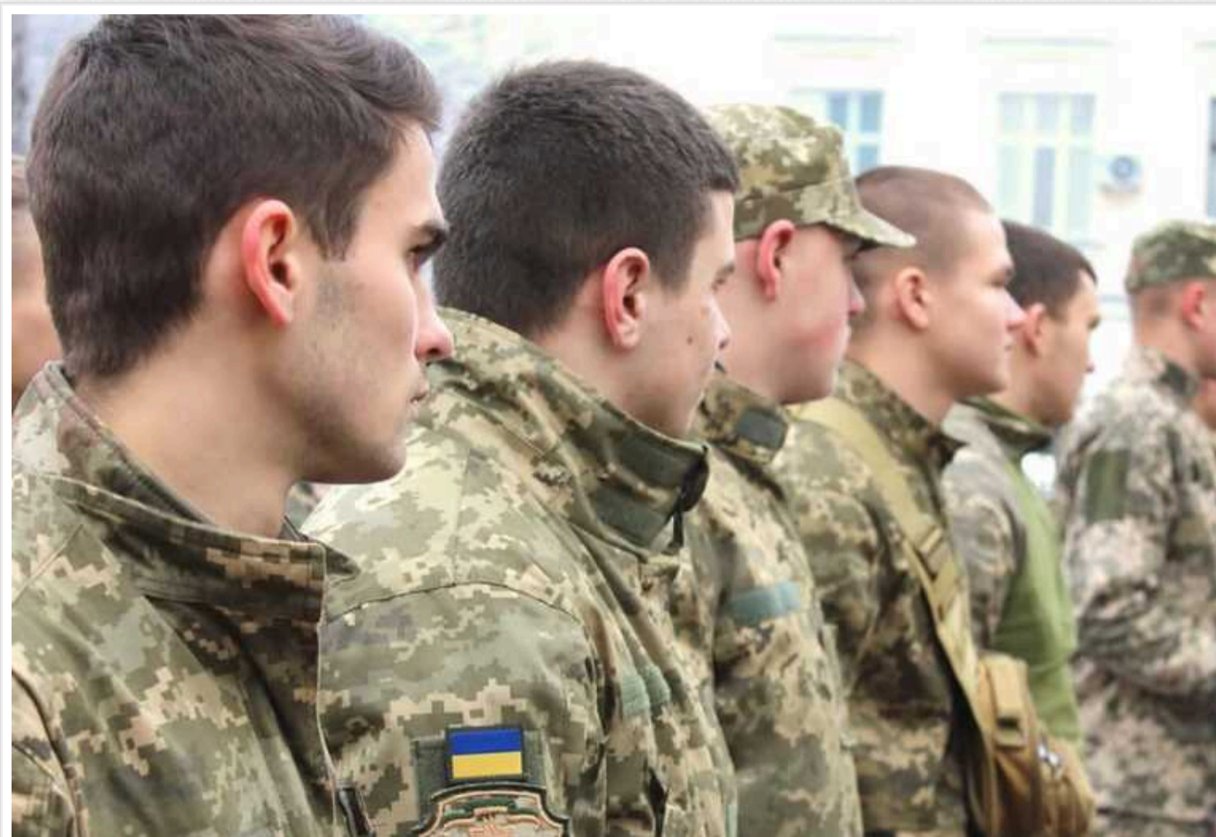
Чоловіки молодше 25 років, які пройшли базову загальновійськову підготовку або базову військову службу, не будуть направлятися на ВЛК, – Кабмін

Згідно з новим порядком, затвердженим Кабміном, хлопці молодше 25 років, які пройшли базову загальновійськову підготовку або базову військову службу, не направлятимуться на ВЛК.