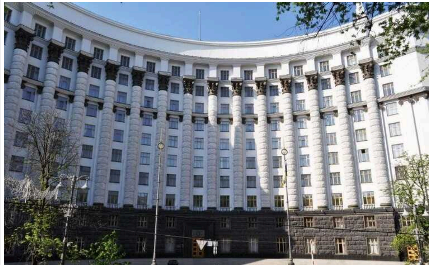
Відстрочка для родичів інвалідів 1-2 групи: Кабмін опублікував зміни

Кабмін також опублікував зміни щодо відстрочки для родичів інвалідів 1-2 групи.