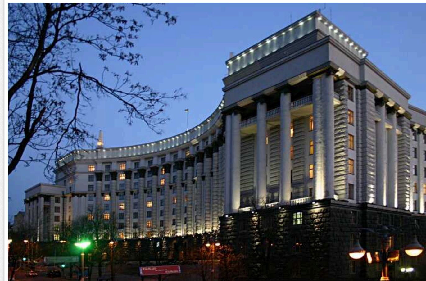
Постановка на облік військовозобов'язаних, які перебувають за кордоном: Кабмін опублікував новий порядок

У Кабміні опублікували новий порядок постановки на облік військовозобов'язаних, які перебувають за кордоном і офіційно знялися з обліку перед виїздом з України.