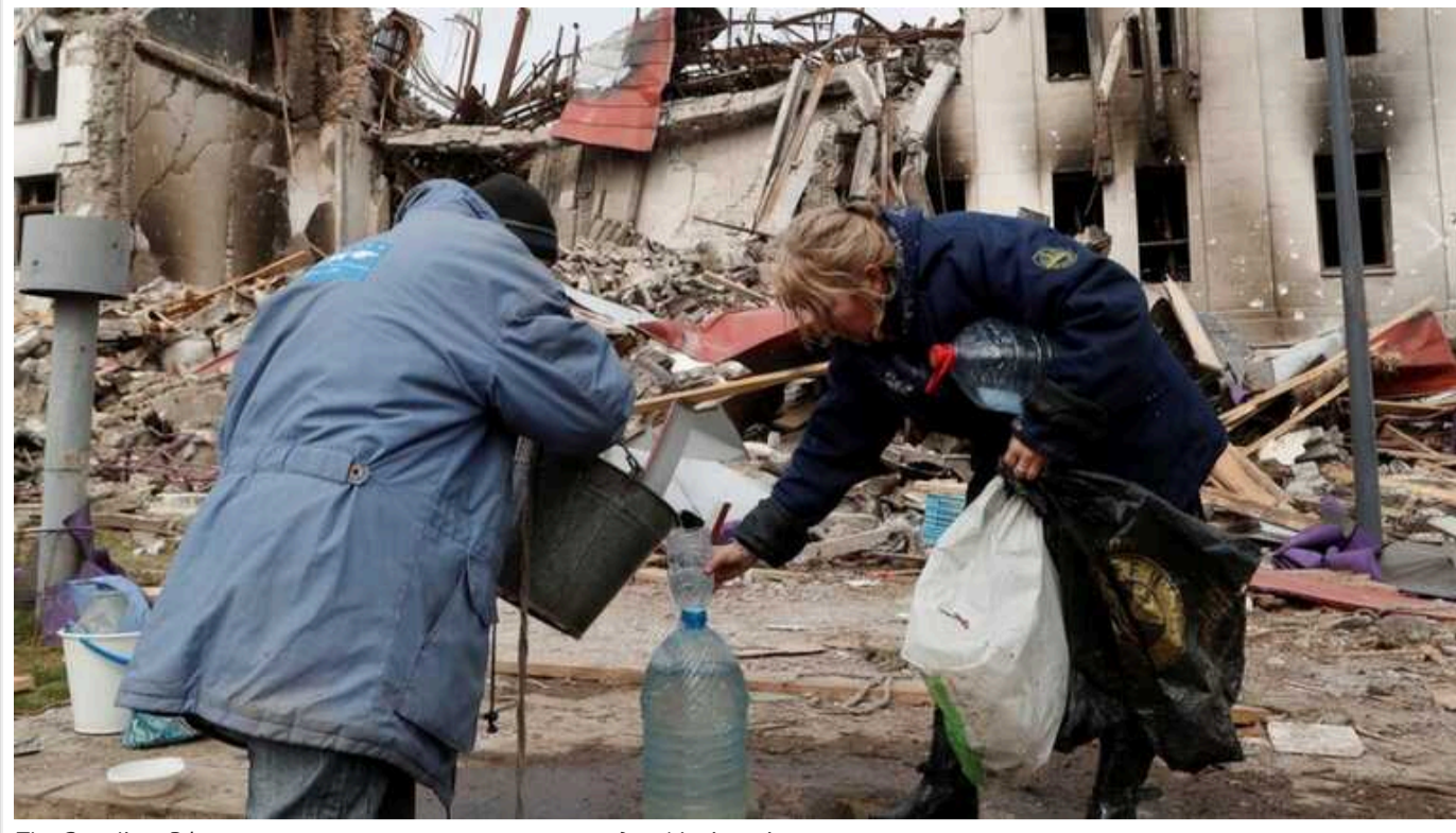
The Guardian: РФ використала навмисну тактику голоду у Маріуполі

Росія застосувала навмисну тактику голоду під час захоплення Маріуполя у лютому 2022 року. Юристи кажуть, що стратегія позбавлення мешканців міста їжі під час блокади може бути притрівняно до воєнного злочину.