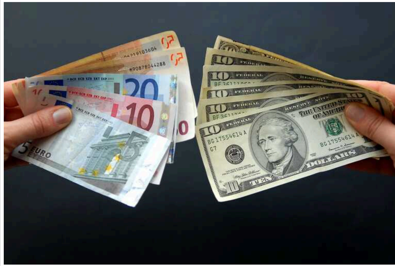
В РФ через нові санкції злякалися «повернення в 90-ті»: Московська біржа припинила торги долларом та євро

У Росії через запровадження санкцій США Московська біржа (МОЕХ) припинила торги долларом та євро. В результаті курс рубля у частині банків злетів на 10% за добу і знову перевищив 100 рублів за долар.