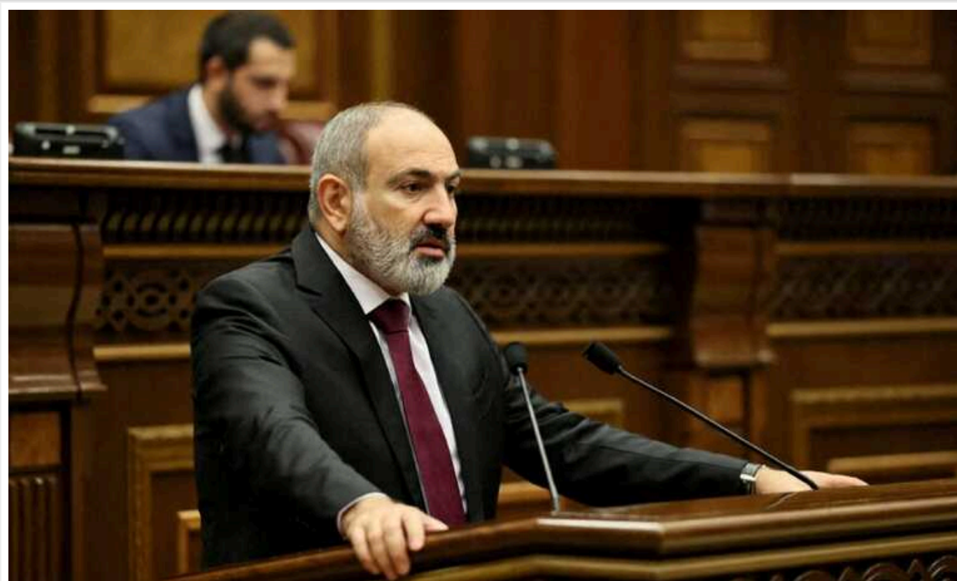
Пашинян заявив, що Вірменія вийде з ОДКБ

Вірменія припинить членство в Організації договору про колективну безпеку (ОДКБ), яку Єреван вже неодноразово критикував.