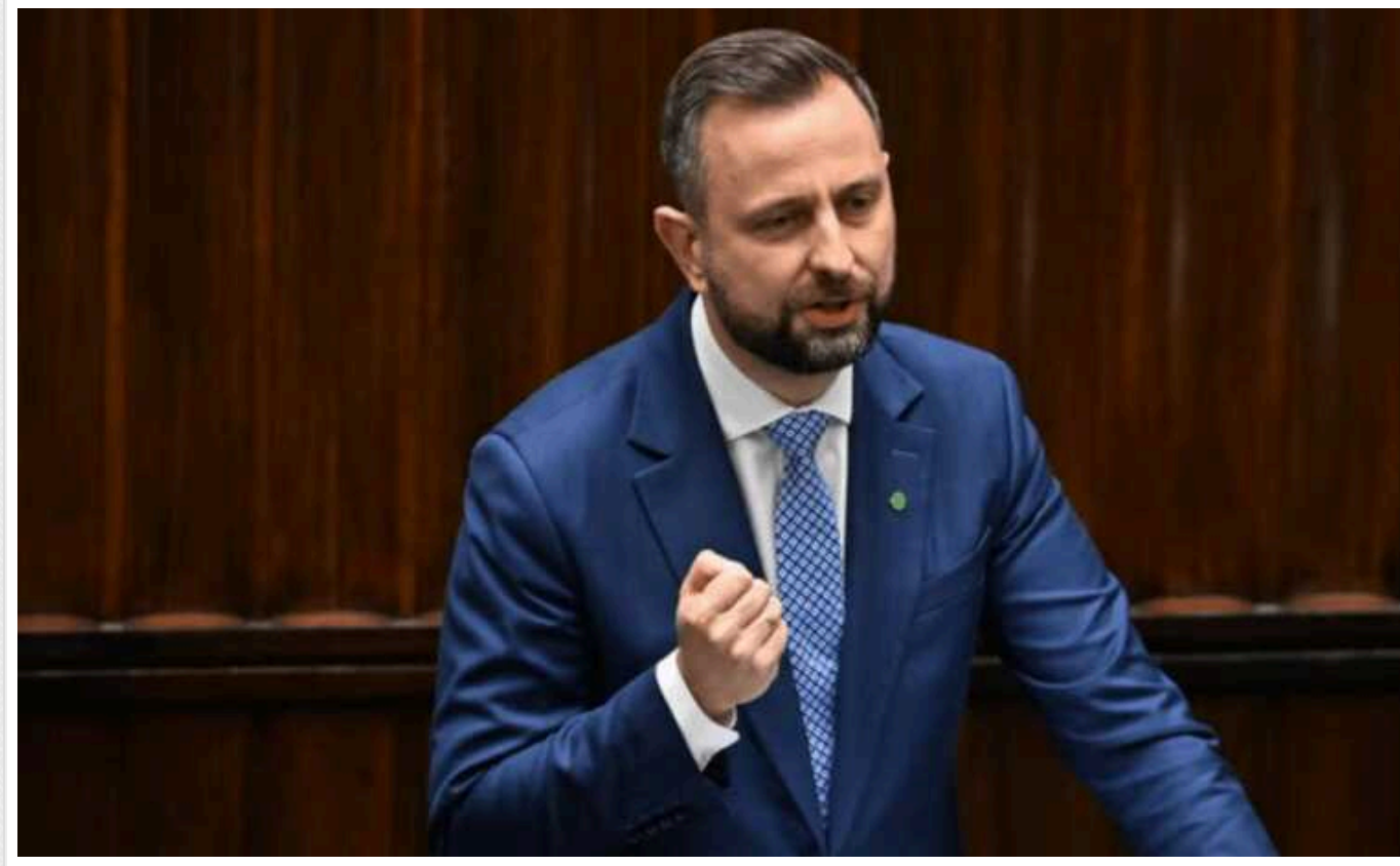
У Польщі хочуть пом'якшити обмеження на використання зброї прикордонниками

11 червня глава Міноборони Польщі Владислав Косіняк-Камиш, у зв'язку із ситуацією на польсько-білоруському кордоні, заявив про заплановані зміни в Кримінальному кодексі щодо застосування вогнепальної зброї, щоб у солдатів не було сумнівів у тому, на чьому боці держава.