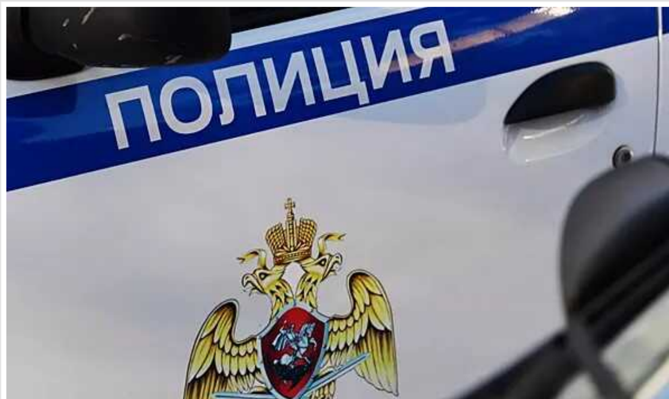
У РФ на вчительку завели кримінальну справу за те, що розповіла дітям правду про Бучу

Жінка показала учням кілька відеороликів наших українських ЗМІ та порівняла РФ із нацистською Німеччиною.