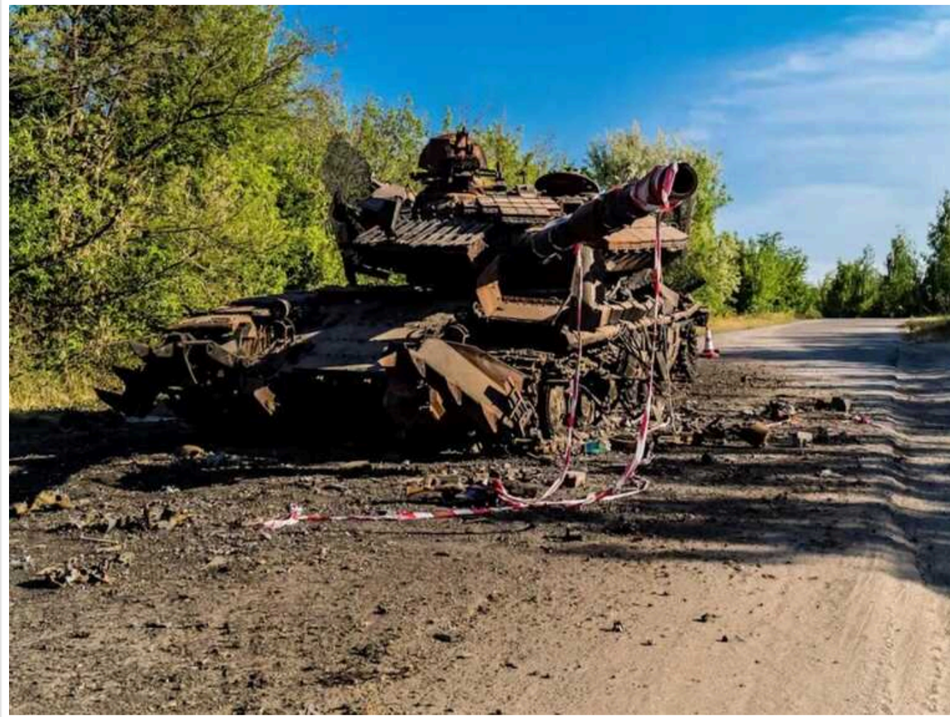
Генштаб оновив втрати РФ в Україні за добу: знешкодили 980 загарбників і 17 ворожих танків

Сили оборони України минулої доби "відмінували" в боях щонайменше 980 російських окупантів. Так, за час повномасштабної війни війська РФ зазнали вже 522 810 безповоротних і санітарних втрат у живій силі.