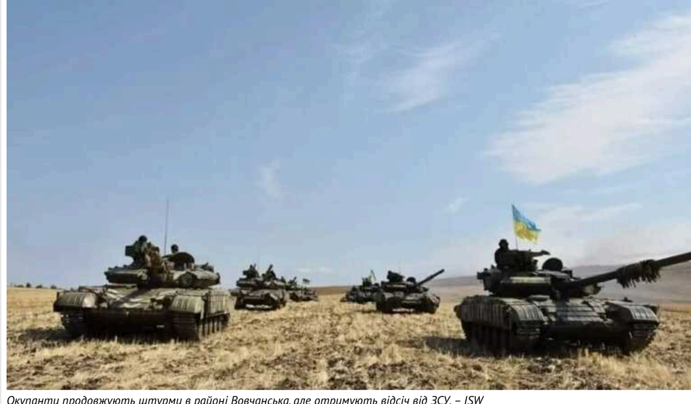
Окупанти продовжують штурми в районі Вовчанська, але отримують відсіч від ЗСУ, – ISW

Російська терористична армія продовжує наступальні дії на півночі Харківської області. Ворог намагається відтіснити українські війська від міжнародного кордону з Белгородською областю та наблизитися до Харкова у межі досяжності ствольної артилерії.