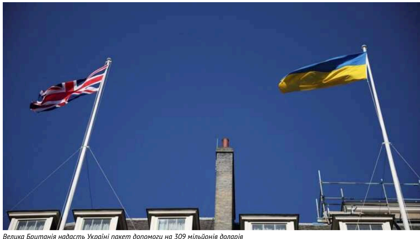
Велика Британія надасть Україні пакет допомоги на 309 мільйонів доларів

Велика Британія надає пакет фінансування на суму до 242 мільйонів фунтів стерлінгів (приблизно 309 млн доларів) для невідкладних гуманітарних, енергетичних та стабілізаційних потреб України.