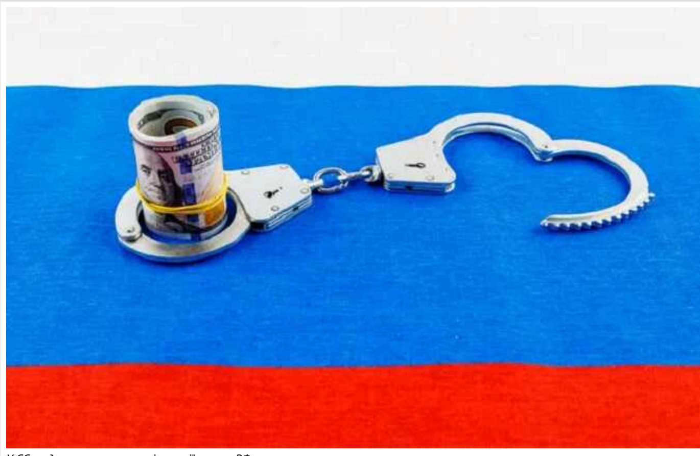
У ЄС не домовилися про нові санкції проти РФ

У Євросоюзі не дійшли згоди щодо нових санкцій проти Росії: проти Німеччина.