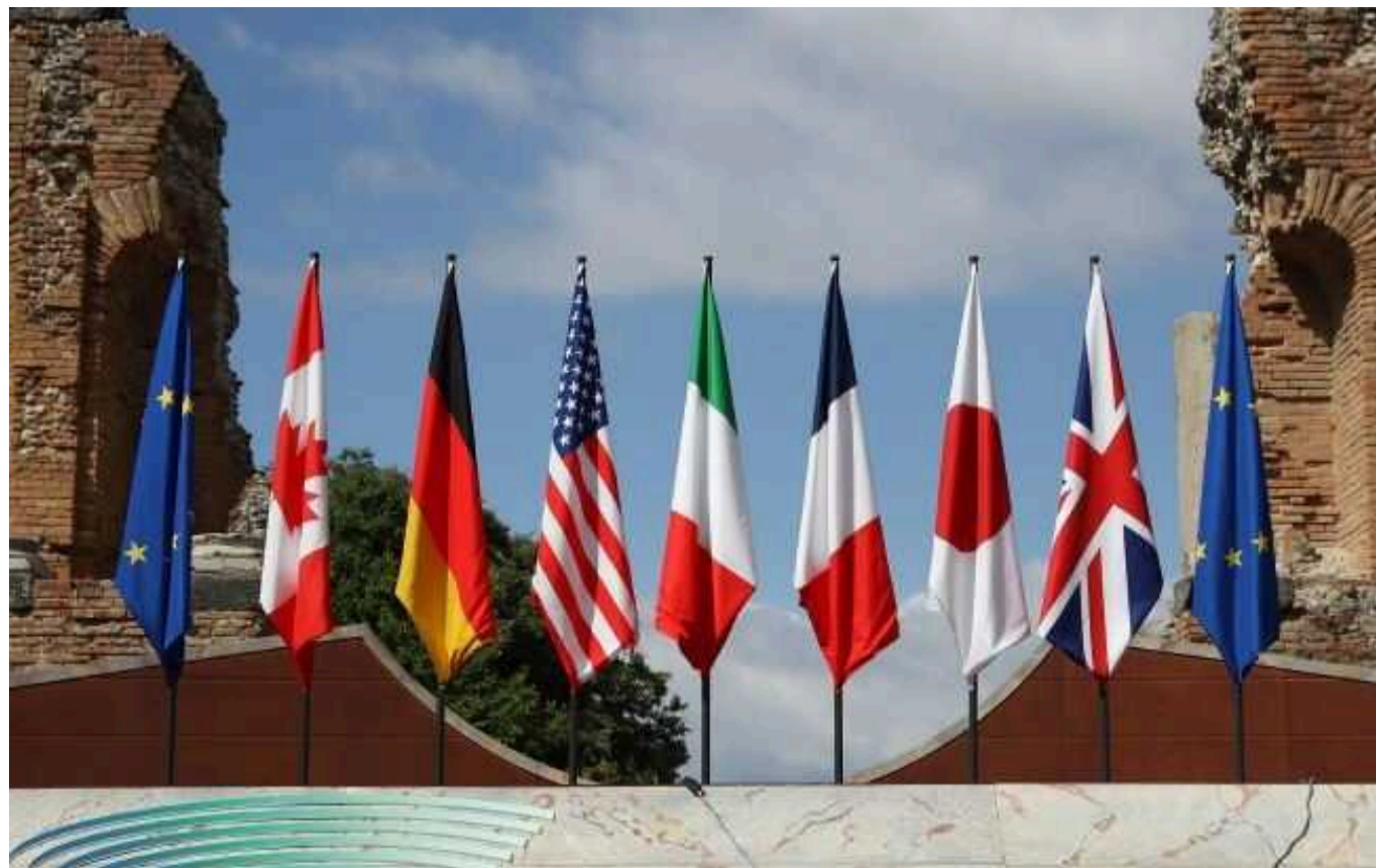
У країнах "Великої сімки" домовилися про виділення Україні 50 мільярдів доларів за рахунок прибутку від заморожених росактивів

У G7 домовилися про виділення Києву $50 млрд до кінця року за рахунок прибутку від заморожених активів.