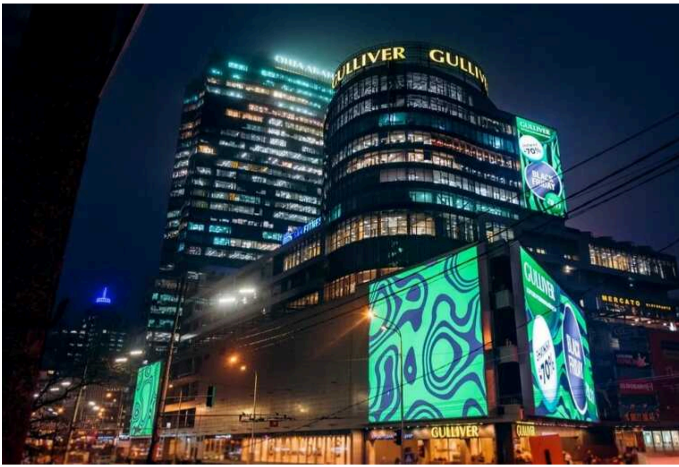
«Ощадбанк» несе мільярдні збитки через кредит для ТРЦ «Гуллівер»

Збитки «Ощадбанку» через припинення виплат за кредитом власників ТРЦ «Гуллівер» можуть сягнути 21 млрд грн. Це дорівнює 75% власного капіталу банку, який наразі становить 28,5 млрд грн.