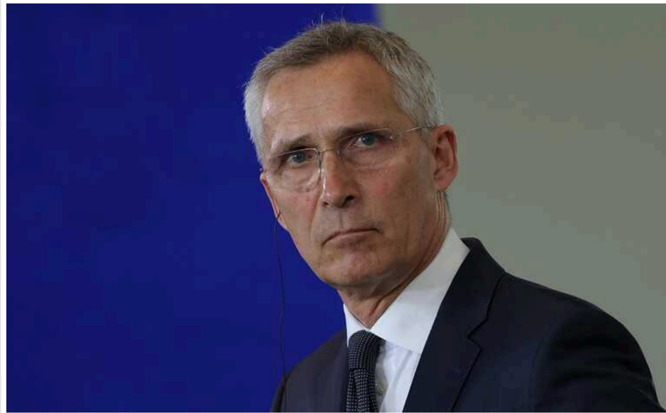
Столтенберг розповів, чого Україна може очікувати від саміту НАТО у Вашингтоні

Лідери країн НАТО під час саміту Альянсу у Вашингтоні 9-11 липня обговорюватимуть допомогу Україні. Однією з тем стане координація постачання зброї.