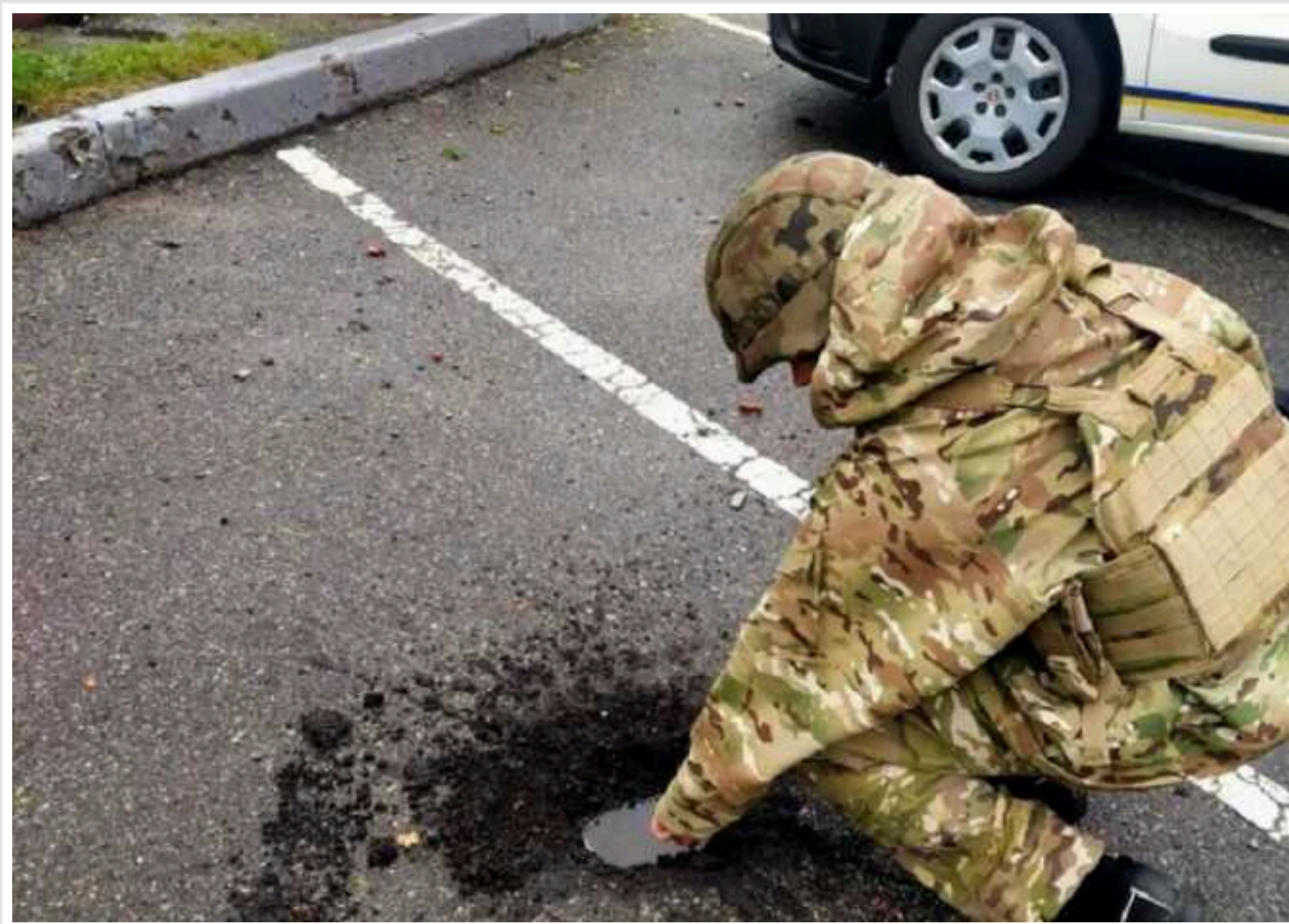
На Київщині після обстрілу РФ виявили фрагменти касетних суббоєприпасів

Після нічної атаки росіян 12 червня на території Київської області поліцейські виявили фрагменти небезпечних касетних суббоєприпасів. Вони можуть здетонувати від найменшого руху.