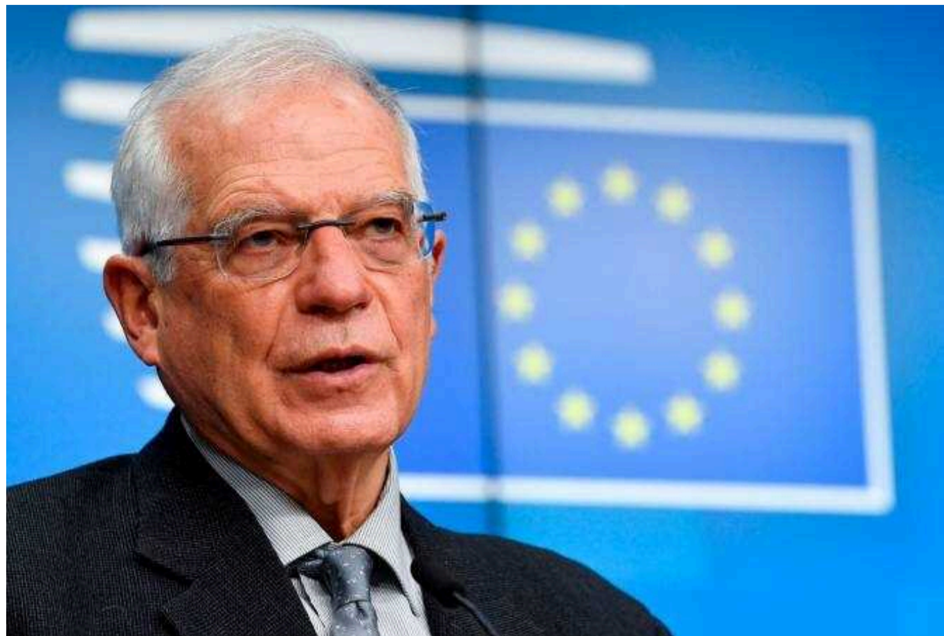
Саміт миру не є майданчиком для прямих переговорів між Україною та РФ, - Боррель

Саміт миру у Швейцарії не є платформою для прямих переговорів між Україною та Росією. У цьому заході візьмуть участь близько 100 країн, і його метою є розробка спільних параметрів миру, які ґрунтуються на міжнародному праві та Статуті ООН.