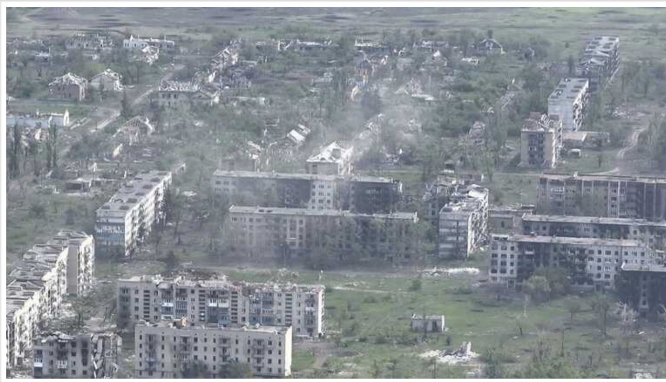
В ОВА розповіли про ситуацію в Часовому Яру: у місті під вогнем РФ досі залишаються люди

У Часовому Яру, що на Донеччині, досі залишаються люди. Місто майже знищене та знаходиться під постійною атакою російських військ.