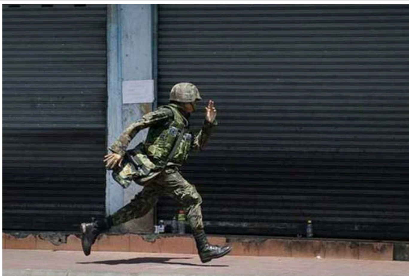
Шанс для дезертирів: армія замість в'язниці

Рада пропонує пом'якшити покарання для дезертирів. Згідно з новим законопроектом, уникнути кримінальної статті вдасться, якщо солдат уперше вчинив правопорушення, розкався і готовий повернутися на службу. У виданні розбирались, з чим пов'язане дезертирство в армії і які масштаби проблеми.