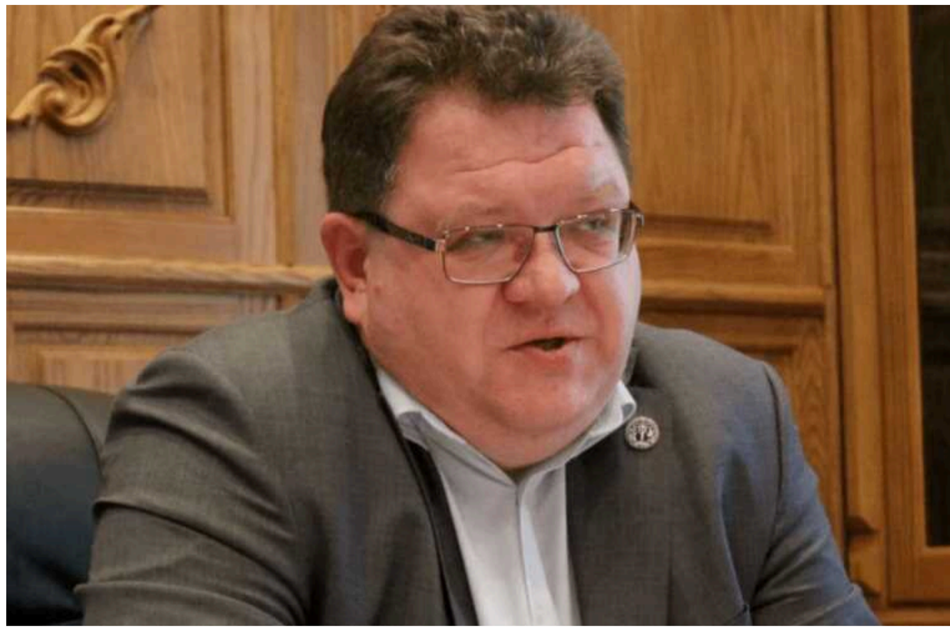
Суд відмовив ексочільнику Касаційного господарського суду Богдану Львову у поновленні на посаді

Про це повідомили судді під час засідання, яке відбулося у середу, 12 червня.