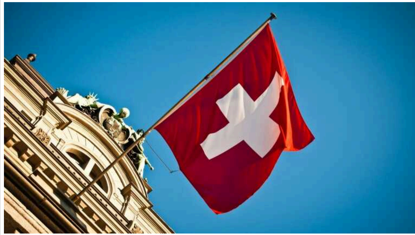
У Швейцарії посилили правила надання тимчасового захисту для українців

Рада кантонів Швейцарії 12 червня проголосувала за зміни у наданні статусу тимчасового захисту S для українців, що тікають від війни: тепер на нього можуть претендувати тільки вихідці з окупованих територій або регіонів з активними бойовими діями.