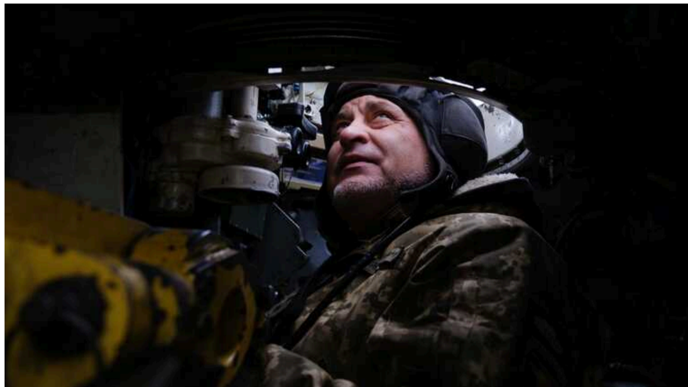
Ситуація на фронті: упродовж доби зафіксовано 74 бойових зіткнень

Ворог збільшив кількість атак на Куп'янському напрямку, а найбільшу активність окупанти демонструють на Покровському напрямку.