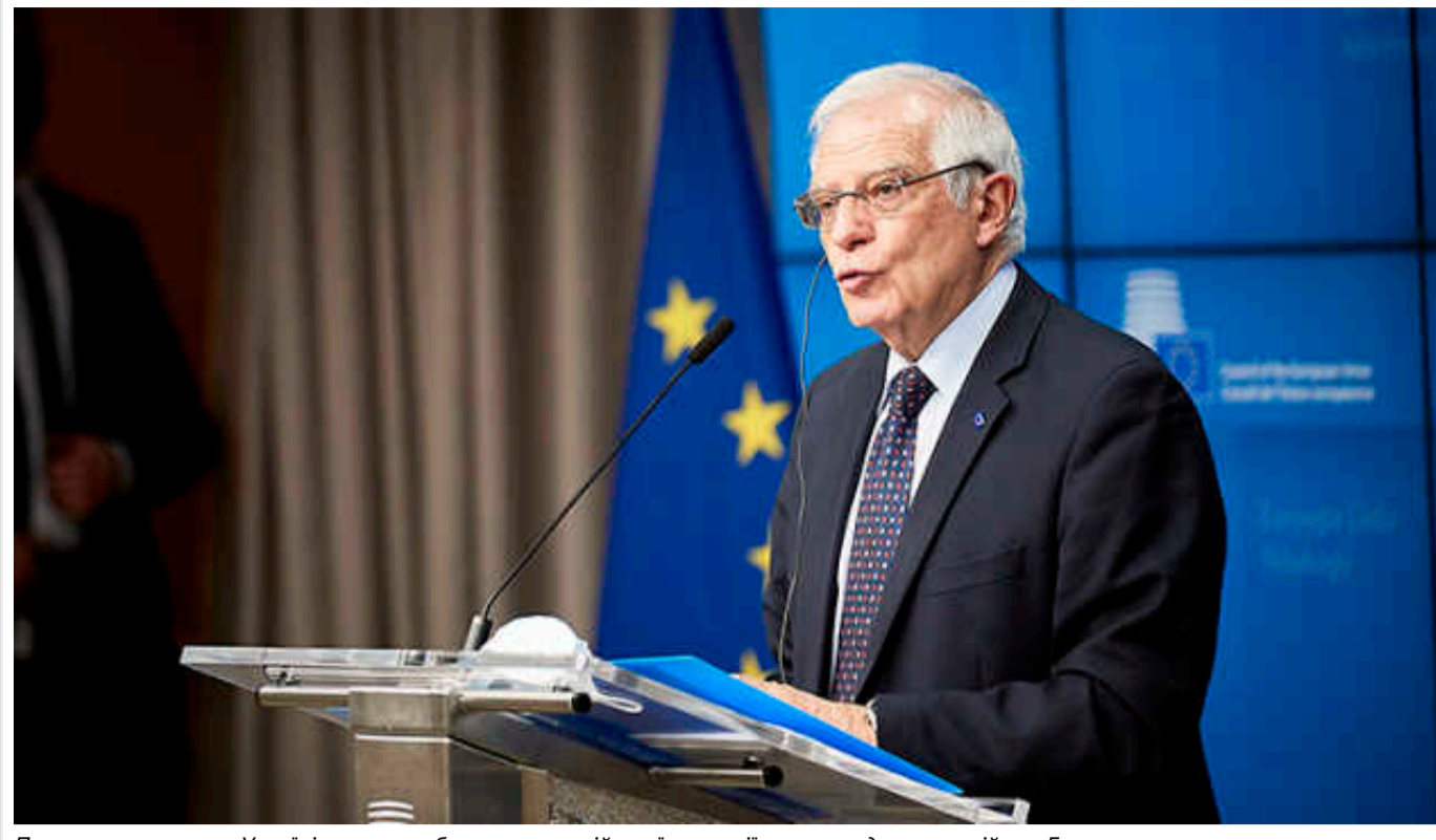
Припинення вогню в Україні за умови збереження російської окупації лише продовжить війну, - Боррель

Будь-які пропозиції щодо припинення вогню за умови збереження репресивного окупаційного режиму на тимчасово окупованих Росією територіях України є небезпечними як для України, так і для європейської безпеки, оскільки такий розшток міг би лише спровокувати країну-агресорку на подальші територіальні зазіхання.