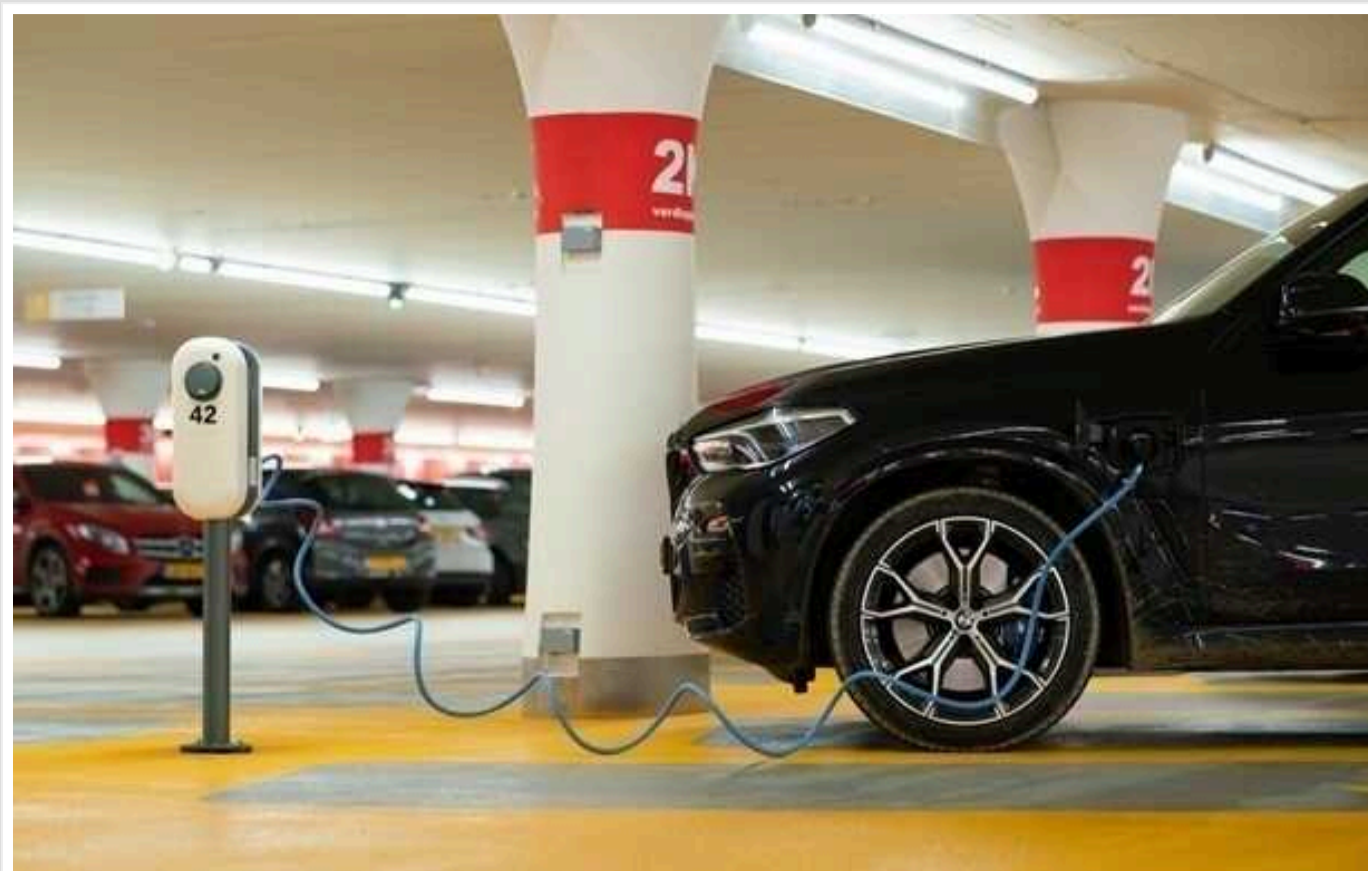
Politico: Єврокомісія збільшила мита на китайські електромобілі до 38%