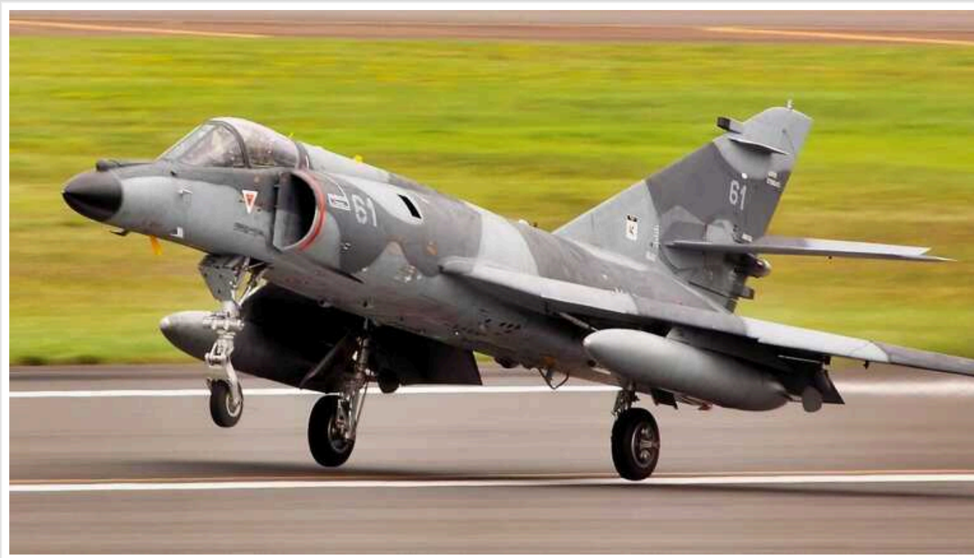
Уряд Аргентини планує передати Україні штурмовики Super Etendard

Аргентина планує передати Україні літаки, здатні нести протикорабельні ракети.