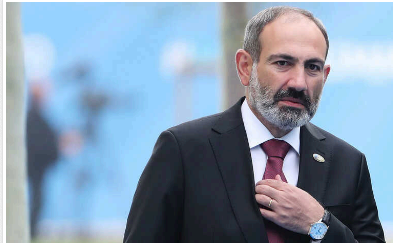
Вірменія вийде з ОДКБ, коли влада «вважатиме це за потрібне», - прем'єр Пашинян

"Вийдемо - ви нас цим лякаєте? Добре, робимо, ми самі вирішимо, коли вийдемо", - заявив прем'єр-міністр Вірменії під час урядової години в парламенті, коли мова зайшла про ОДКБ.