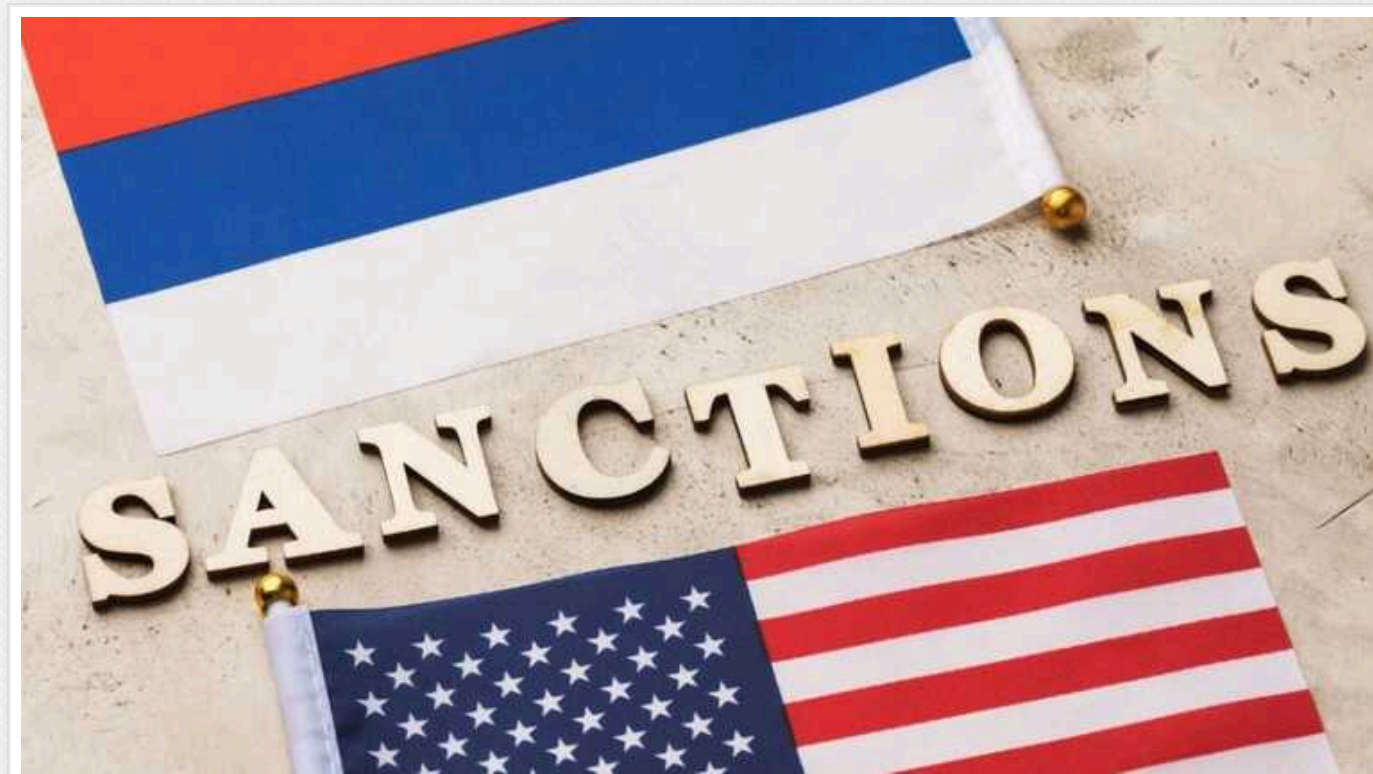
FT: Сполучені Штати хочуть учетверо розширити вторинні санкції проти РФ

Міністерство фінансів США планує цього тижня значно розширити вторинні санкції щодо Росії, розглядаючи будь-яку іноземну фінансову установу, яка здійснює транзакції з російською компанією, що потрапила під санкції, як таку, що працює безпосередньо з військовою промисловістю Кремля.